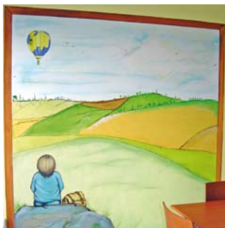
Peinture décorative salle de restauration de la pépinière d'entreprises

Au total pour ce premier semestre, ce sera plus de 5 000 heures de formation qui auront été suivies par les salariés des chantiers de la Thiérache du Centre. Autant