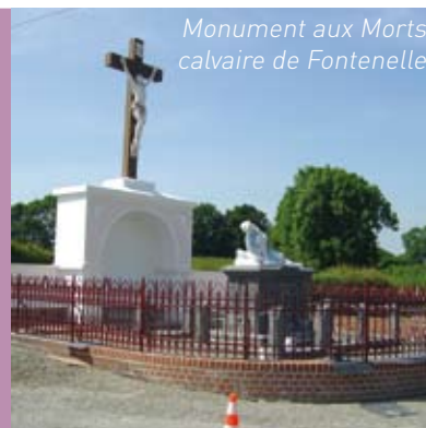
Monument aux Morts calvaire de Fontenelle

Le Hérie La Viéville , travaux également prévus en plusieurs tranches commencés fin 2009, poursuivis au 1er trimestre 2010 et qui devraient être terminés pour la fin d'année.